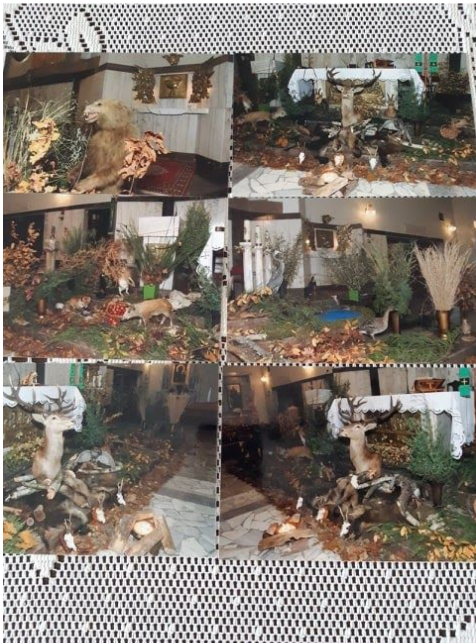
fot. dekoracje kościoła

Dużą grupę stanowią również myśliwi, którzy obchodzą corocznie swoje święto Hubertusa. Rozpoczynają sezon polowań mszą św. z udziałem poczty sztandarowego Koła Łowieckiego oraz sygnalisty myśliwskiego, przygotowują specjalną dekorację, którą stanowią trofea myśliwskie.